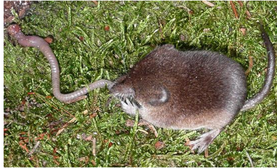
Habita als boscos i prats

S'alimenta de larves, d'invertebrats i de cucs